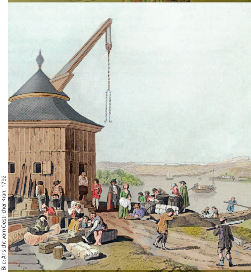
Bild: Ansicht vom Oestricher Kran, 1792