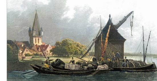
Oestricher Landkran um 1824

Der Kranmeister rechnete mit dem Landschreiber ab, der die Besitzungen des Erzstifts im Rheingau verwaltete und alle Gelder einzog, die dem Mainzer Erzbischof zustanden. Vom Krangeld wurden Ausgaben für Löhne und Reparaturen abgezogen, zum Beispiel die Kosten für den Ersatz von verschlissenen Seilzeug. Die verbliebenen Überschüsse zahlte der Landschreiber bei der Mainzer Hofkammer ein.