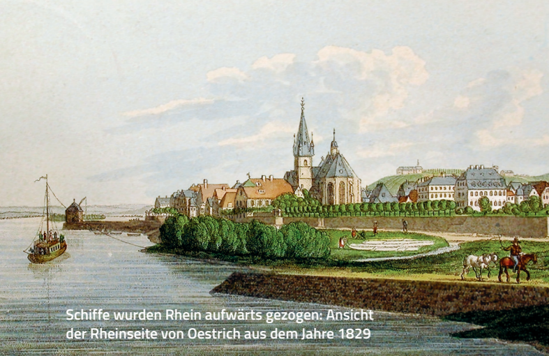
Schiffe wurden Rhein aufwärts gezogen: Ansicht der Rheinseite von Oestrich aus dem Jahre 1829